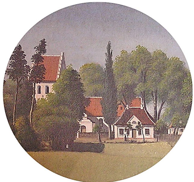
Frelserens hospital beliggende tæt ved Otterup Kirke. Udsnit af maleri i Otterup Museum.

Dengang var det også meningen, at det skulle have været revet ned, for at vejen kunne blive rettet ud, men det fik jeg forpurret, og i stedet blev huset fredet. Allerede dengang lovede man mig, at jeg måtte indrette museum her, men da der manglede plads til biblioteket, bliver løftet først opfyldt nu. Drømmen om et museum er altså ikke af ny dato?