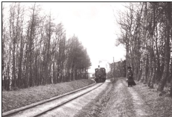
Nordfynske Jernbane. Toget på vej mod Otterup Station.

- De havde i hvert fald ikke noget godt ry paa sig. Det hed sig, at de især var glade for æg, men yderst kede af at betale noget som helst for dem. Det var nu godt, at man ikke var sognefoged dengang.