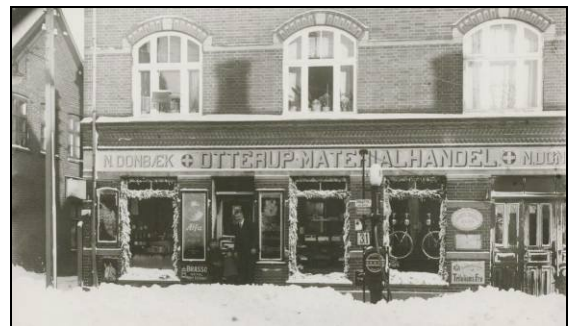
Købmand Donbæk har julepyntet butikken i Jernbanegade med granguirlander i vinduerne.

Artikel efter Fyns Tidende 18.12.1958. Digitaliseret til Nordfynsk.dk af Margit Egdal 30.6.2011.