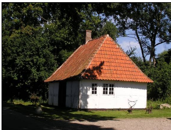
Tåstrup Smedje blev i 1931 flyttet til Hjemstavngården i Gummerup.