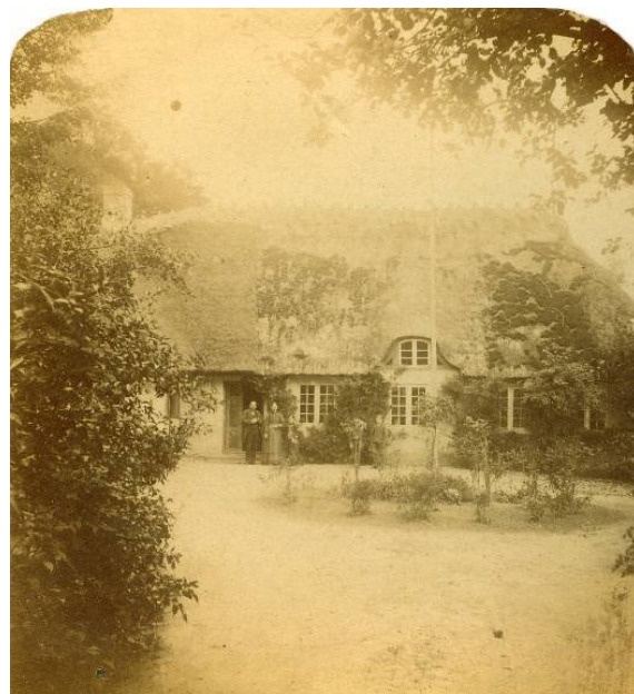
Lunde Skole. Kopi efter stereoskopfoto.

Teksten er digitaliseret af Margit Egdal 4.1.09. Fotos og tekster til fotos er indsat af samme.