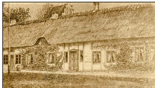
Præstegaarden.