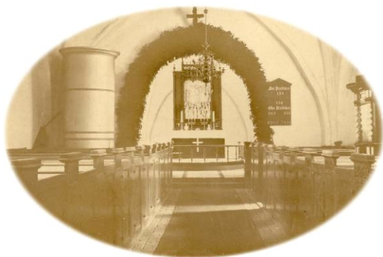
Lunde Kirke. Interiør.

Barneminder rækker langt. Jeg forsøger her at gengive nogle fra mit Fødesogn: