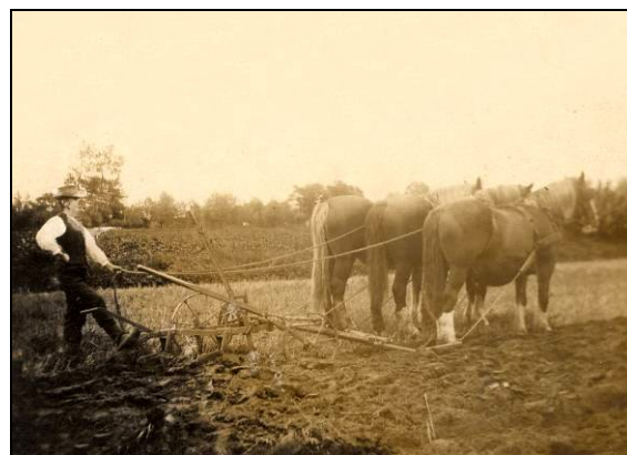
Skrællepløjning i Fremmelev. Ploven er en dansk ramme-dobbeltplov.

Erhvervsforholdene i Lunde Sogn var sunde og gode. Gaardmændene drev deres Jorder godt, Afgrøderne var rene som Følge af den omhyggelige Behandling, som Brakmarken fik. Der var ingen Mangel paa Arbejdskraft, da der altid var et godt Forhold mellem Husbond, Madmoder og Tyendet. Hver Gaardmand havde sin Husmand at pløje for.