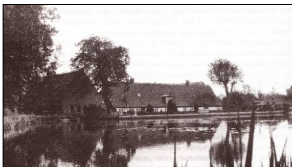
Lunde Mølle. Forreste mølledam.

Ved Bredden af „forreste Mølledam" voksede høje Siv, som af kyndige Mænd blev benyttet til at lave "Stavpuder" af – noget af Datidens Seletøj, som blev anvendt, naar Hestene arbejdede i Marken.