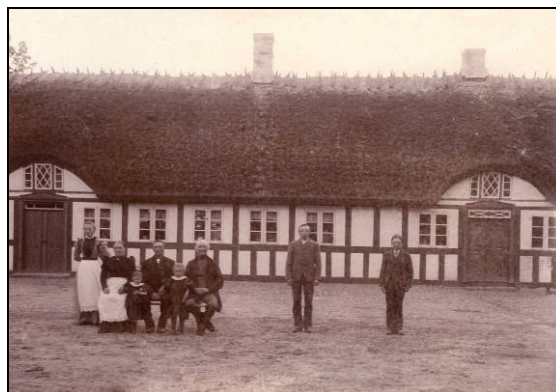
Østerlund 1898. Den ny, grundmurede gård med rødstens stuehus blev opført 1907. Adressen er Lunde Bygade 58.