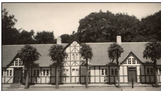
En af Nordfyns smukkeste bindingsværks-gårde, Fremmelev 10, gik tabt i en brand i høst 1992.

Paa et Højdedrag i „den lille Mosegyde“ samledes Ungdommen hver Sankt Hansaften og tændte Sankt Hansblusset, som da lyste viden om. I Byen laa tolv Gaarde og seks Huse. Nogle af Husene havde et Tilliggende paa et Par Tønder Land, som var Udmarksjord.