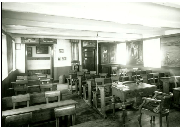
Gyngstrup Skole – det store, sorte skorstenshul hvor skrækslagne elever kunne sidde og komme på bedre tanker, er dog borte her.

Som alt bemærket, måtte han allerede, da han var ti år gammel, være med til at tjene til føde og klæder. Det skal her udtrykkelig bemærkes, at der også til klædedragten, som til føden, stilledes ganske minimale fordringer.