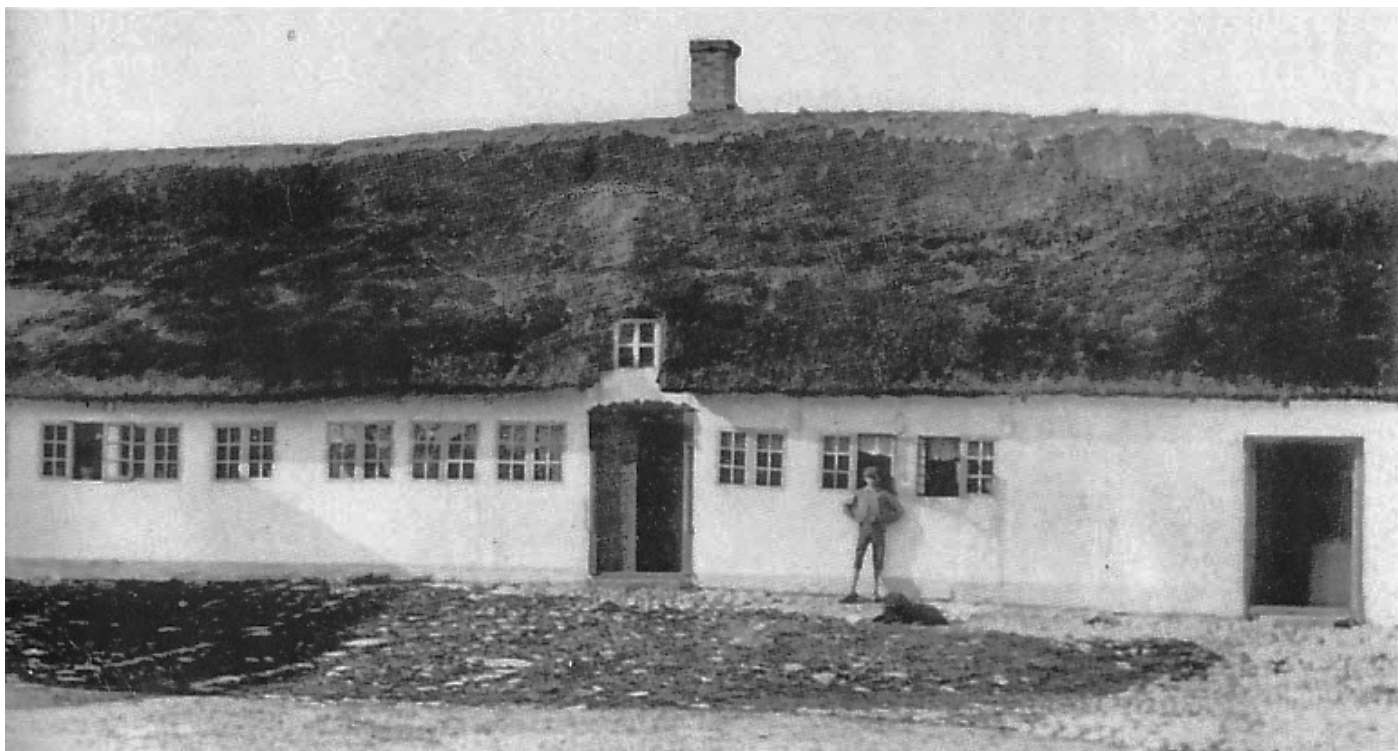
Ellegård i Gyngstrup. Byens nordøstligste gård. Ved udskiftningen fik gården sin jord samlet vest for gården, ligesom byens øvrige gårde også fik samlet deres jorder. En smuk udskiftning.