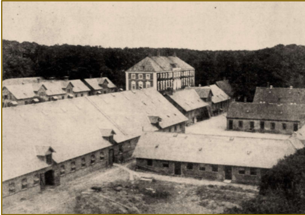
Udsigt fra godsets vejmølle, der driver elektricitetsværket. Man ser en del af avlsbygningerne med hovedbygningen i baggrunden.