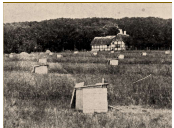
Et udsnit af marken med fasaneriets mange småhuse.

På nogle store marker med alenhøjt græs lige mellem de store græsgange og skovene, har godsejeren ladet indrette et stort fasaneri. Mellem det høje græs ligger lange rækker af små hvide huse. Dette er også alt, hvad man ser, når man nærmer sig græsmarkerne, men går man forsigtigt nærmere og ned mellem de lange rækker huse, ser man i hundredvis af små, vævre fasankyllinger, der piler afsted eller lægger sig fladt ned på jorden, når de ser fredsforstyrrelser komme. De små fasankyllinger er blevet udruget af almindelige høns, efter at man har fanget fasanerne om vinteren og holdt dem i store overdækkede gårde vinteren og foråret igennem. Når de så har lagt æggene, får de lov at slippe ud i skoven igen, mens æggene bliver bragt til et stort rugehus ved det idylliske skovfogedhus. Her ligger i små kasser et stort antal rugehøns, og under dem bliver æggene så lagt. Så snart æggene er blevet udruget, flyttes hønen og kyllingerne ud i græsmarkerne. Her løber de små kyllinger fra morgen til aften og befinder sig strålende på det dejlige terræn. Men også her lurder faren. Rovfugle, måger, krager og væsler gør ofte angreb på de små kyllinger, men for at forhindre dette, står en forstelev dagen lang vagt ved marken for at skræmme angriberne væk.