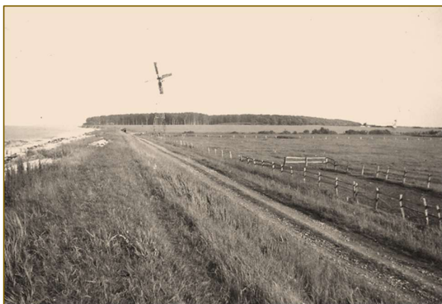
Kystparti med Egebjerggårds Storskov i baggrunden.

Fra klitterne kan man se over til de store skallegrave, der også findes på Egebjerggårds areal. Her er etableret tipvognstog ud i vandet for at skallerne på en let måde kan bringes op på land, hvor de ligger og tørrer, hvorefter de bliver opkøbt af skalle-eksportørerne.