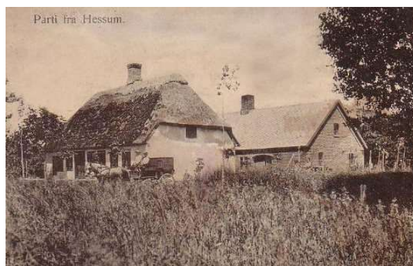
Parti fra Hessum

Der blev ikke tale om velkomstord i store mængder, men folk blev vist ind i den store stue, hvor bordene stod dækket, de satte sig ned og var parate til at nyde den mellemmad, der bestod af bøf og smørrebrød, som de selv måtte tilberede, og hvortil der serveredes snaps og hjemmebrygget øl.