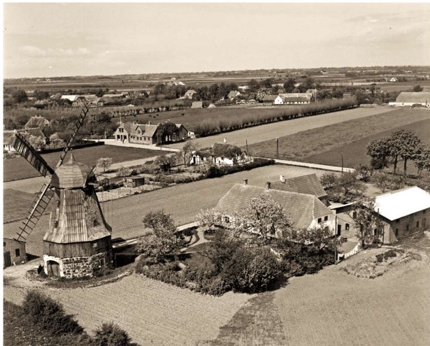
Hessum Mølle ved Harald Petersen. Sylvest Jensen Luftfoto 1953. Det Kgl. Bibliotek. Danmark set fra luften.

flestes vedkommende, men der var også nogle, der snakkede om politik, køer og gode heste, mens de tog en snaps og et glas øl.