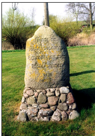
MINDE OM SØNDERJYLLANDS GENFORENING MED MODERLANDET 1920

Den gamle protokol slutter i 1952, hvor der for sidste gang er indført, hvem der passer genforeningspladsen. Regnskabet ses dog ført indtil 1967.